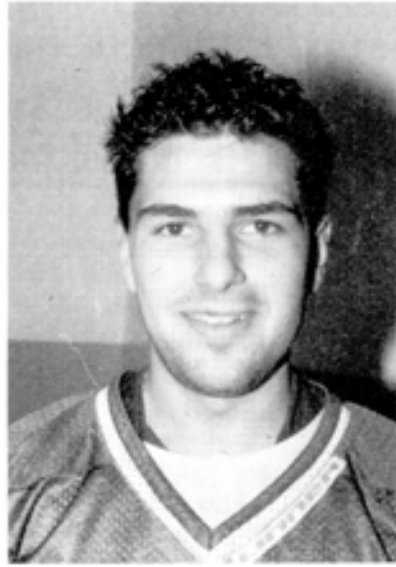
11 Filgis Ken