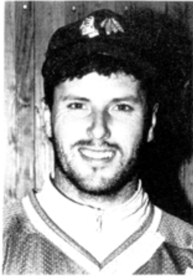
14 St. James