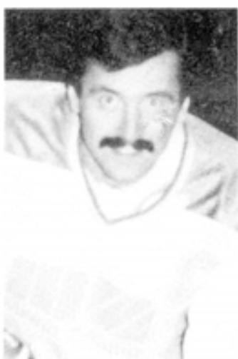
15 Dörfler „C“