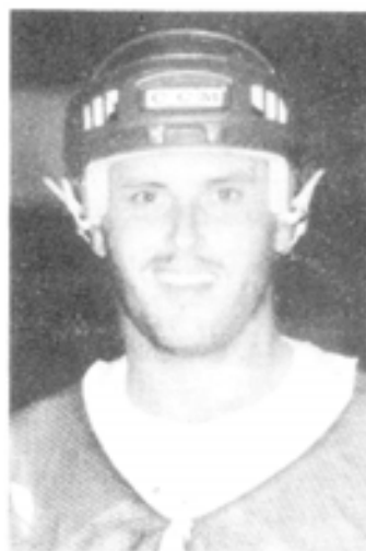
14 St. James